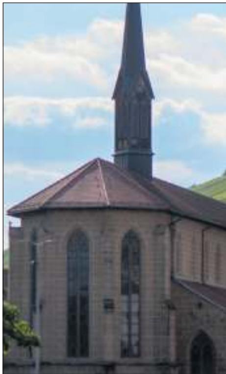
Münster St. Paul