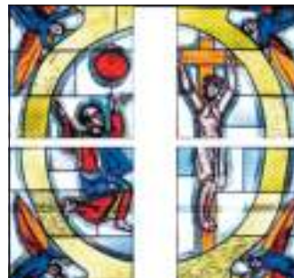
Detail aus dem SüdOst-Fenster im Chor Foto: W. Geyer, Photo T. Themenspaziergi

Nach diesen Ausflügen nähern wir uns dem Fenster im Südosten des Chores. Geschaffen in den 60-Jahren von Wilhelm Geyer zeigt es uns seine Interpretation des Galaterbriefes. Dargestellt sehen wir das mosaische Gesetz, die Bundeslade und das Apostelkonzil: Paulus und Petrus, die Doppelspitze der neuen Gruppe, verständigen sich auf die Anforderungen an Christen: „nicht das Gesetz rechtfertigt vor Gott, sondern die im Glauben an Jesus geschenkte Liebe