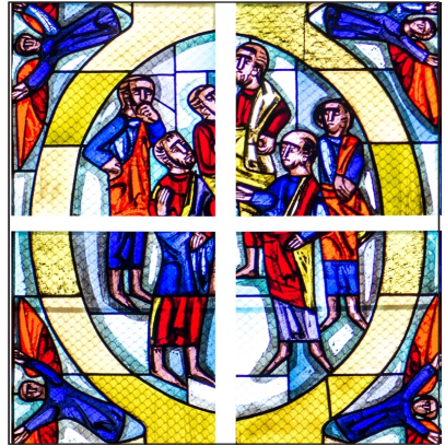
Detail aus dem Süd-Ost Fenster im Chor des Münsters