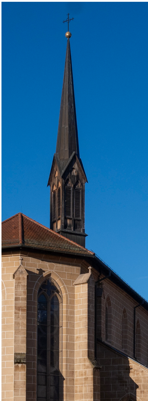
Münster St. Paul Esslingen am Neckar