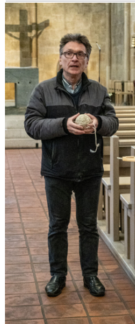
Vorbereitung zum Finden des Maßes

fen mit einer Schnur zeigt sich das Maß von 1:2:1. In den Seitenschiffen bildet die Grundfläche eines Joches ein Quadrat, vier dieser Quadrate finden sich im Hauptschiff als Grundfläche zweier Joche. Ein Ausflug in die Harmonien der Musik, auch hier sind die Verhältnisse ganzer Zahlen Grund für den Wohlklang. Zahlen und ihre Symbolik spielen auch bei Motiven aus der Bildenden Kunst im Münster eine große Rolle. So stehen z.B. die 12 Kreuze an den Wänden der Seitenschiffe für die 12 Stämme Israels, die Dreiteilung der