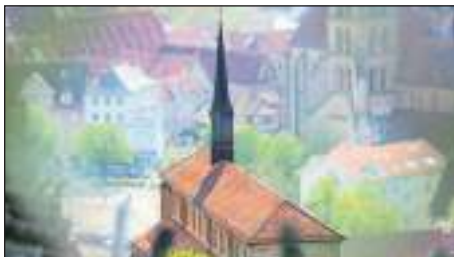
St. Paul vom Neckarhaldentor aus gesehen

Themenspaziergänge finden an jedem dritten Sonntag im Monat statt. Wir freuen uns, wenn Sie sich anmelden unter kircheundkunst@stpaul-esslingen.de Sie können aber auch