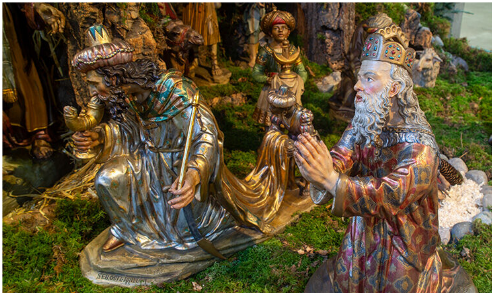
Bildunterschrift: Weise aus dem Morgenland mit Gefolge Dateiname: 202401020424461_2076.jpg